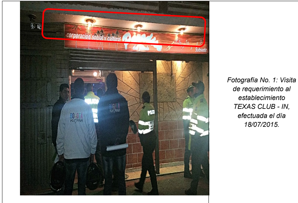
Fotografía No. 1: Visita de requerimiento al establecimiento TEXAS CLUB - IN, efectuada el día 18/07/2015.

Registro fotográfico Visitas al establecimiento de comercio TEXAS CLUB - IN.